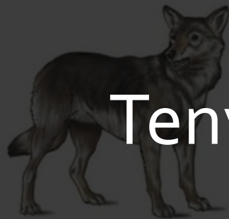
Gray wolf (Common ancestor)