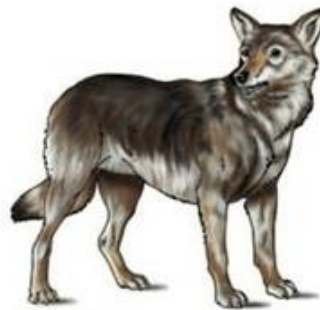
Gray wolf (Common ancestor)